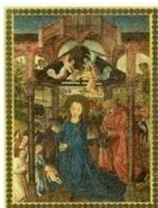
La Natividad. Maestro de Sopetrán. Museo Nacional del Prado. Madrid.